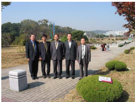
中韩教授在 KAIST 校园合影

KAIST 的校园沉浸在秋日黄色的宁静之中。一泓清水中，倒映着小木桥的情影。偶尔有几声鹅鸣，悠扬嘹亮。