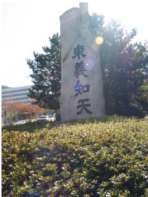
东义大学校训：“东义知天”

11月2日，我们来到同样坐落在山上的另一所大学——东义大学。东义大学是韩国较好的私立大学之一，其校训是“东义知天”。其医学院非常著名。其校园沿山而建，校园建设在釜山市最高的山上，面对城市和海湾，校园宁静，景色优美。