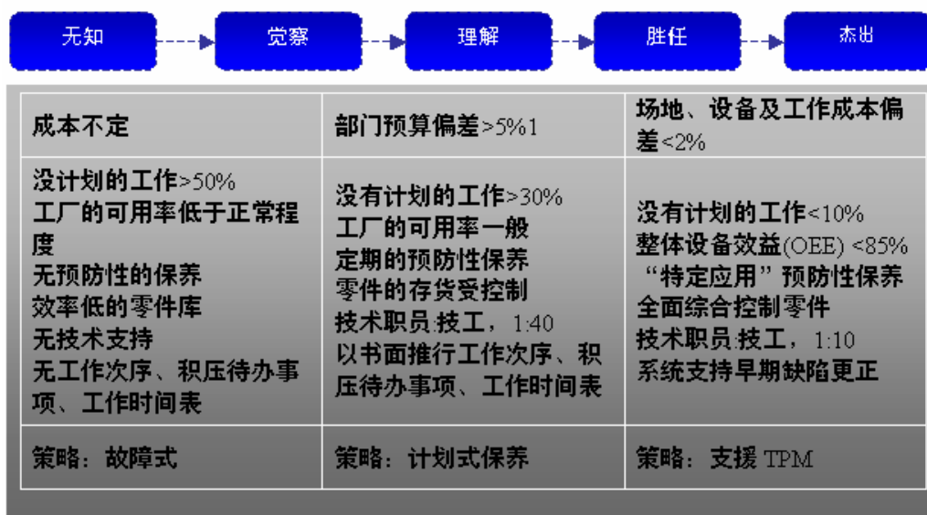
保养管理(TPEM/OEE) “由无知至优秀”的体系