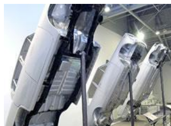
丰田产业技术纪念馆